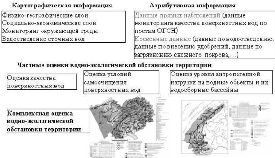
Рис. 3. Водно-экологическая информационно-аналитическая система

чения информации об объектах местности и пространственной привязки тематических сведений.