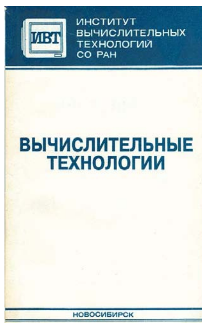
Обложка первого выпуска сборника “Вычислительные технологии”

Последний, 13-й, выпуск вышел из печати в 1995 году и был посвящен главным образом материалам Межреспубликанского совещания по интервальной математике, которое проводилось Институтом вычислительных технологий СО РАН 29–30 сентября